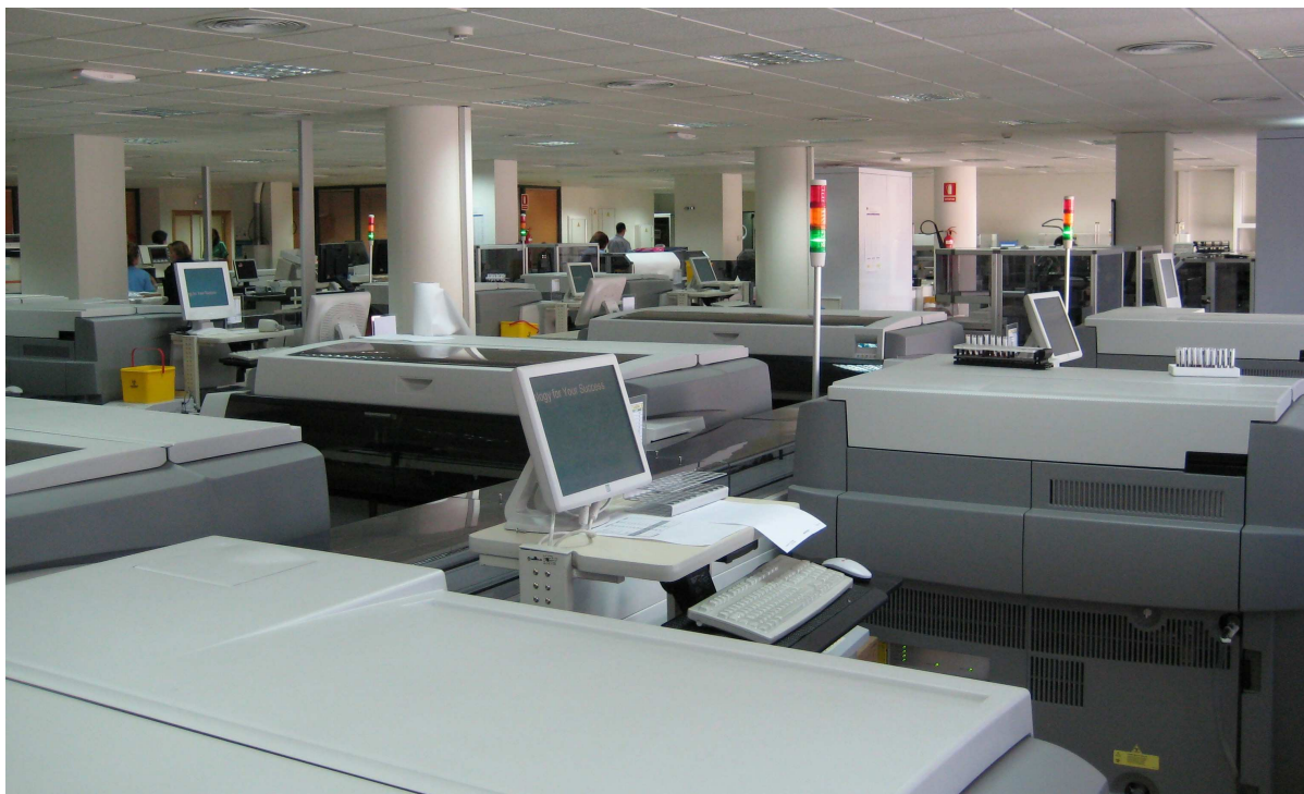
1: Área de automatización

Las actuales instalaciones del laboratorio de análisis constan de una amplia superficie diáfana de unos 500m 2 , situada en la planta baja del hospital, sobre la zona de urgencias, donde se sitúa el área de automatización, y a la que se accede por el pasillo de cafetería, y de una serie de pequeños laboratorios satélites de técnicas especiales. Además, hay un laboratorio de urgencias en el otro edificio (Hospital Provincial), donde también está ubicada la toma de muestras principal. Los laboratorios satélite son el de citogenética, el de genética molecular y el de técnicas manuales, todos ellos adyacentes al principal, y el de reproducción asistida, adyacente a las consultas de fertilidad del edificio materno-infantil. El laboratorio cuenta, además, con un área de urgencias, una zona de recepción y distribución, una unidad administrativa, un almacén con una sala refrigerada de 15m 2 y una habitación de -20°C de 4m 2 , una sala de congeladores y una sala de reuniones. También hay despachos para el Jefe de Servicio, facultativos, unidad de calidad, supervisión de enfermería e informática, así como 2 dormitorios para facultativos de guardia.