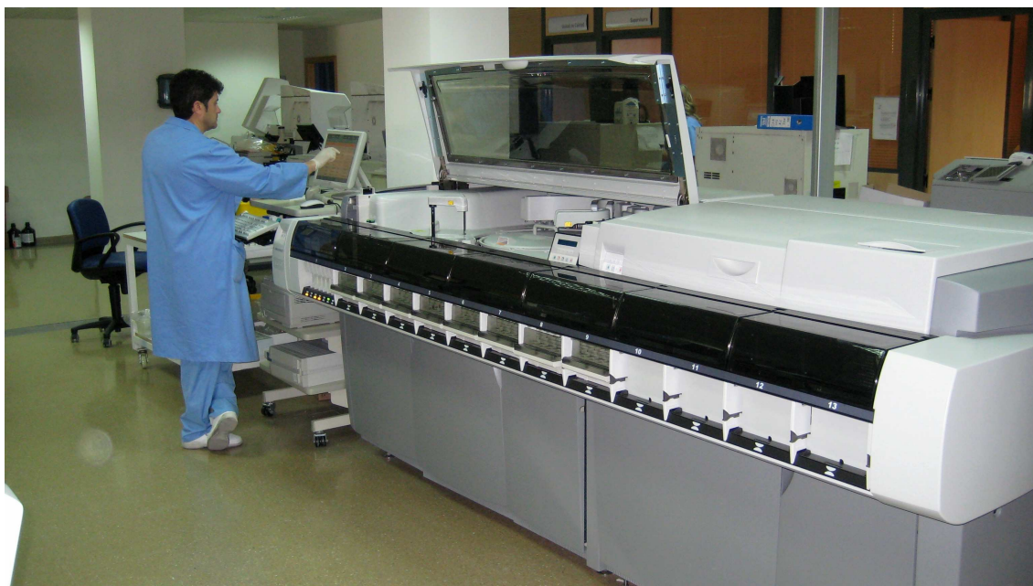
2: detalle de la zona de urgencias

Adyacente a la zona de automatización hay también un estar de personal técnico y una pequeña habitación frigorífica de 4m 2 .